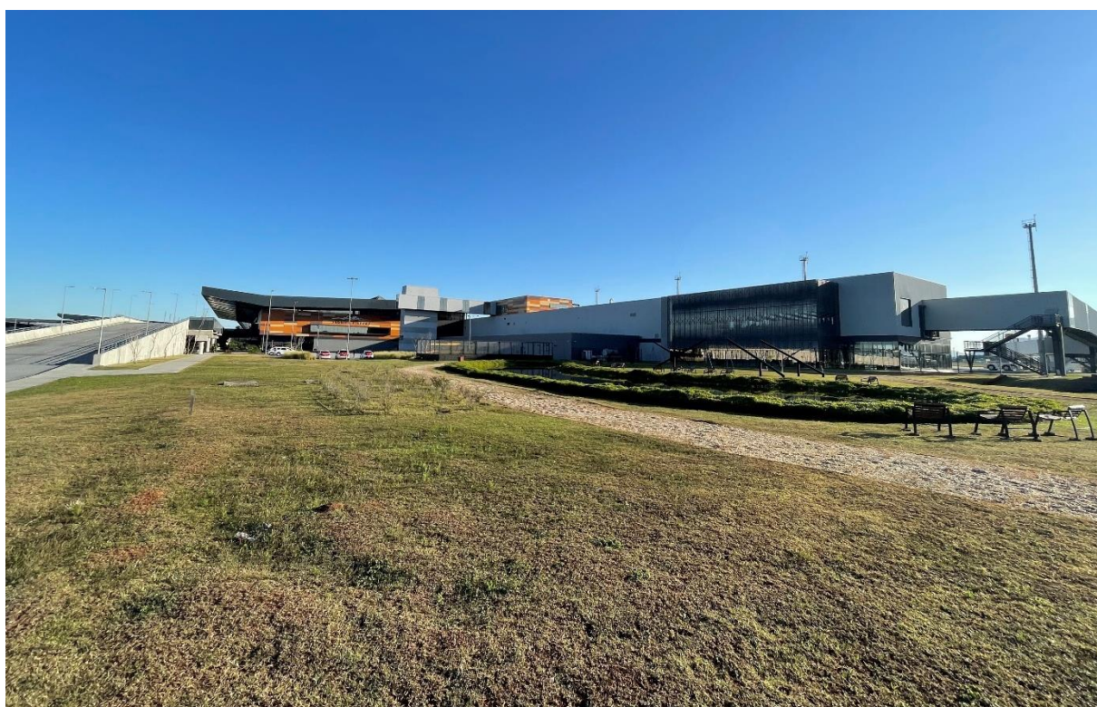
Figura 2 - Vista do local onde será instalada a Obra de Arte